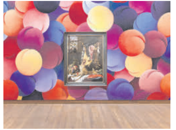
ARTE Y CULTURA VIBRANTE. Esta metrópoli cuenta con múltiples galerías y espacios de exposición.

ESTA CIUDAD SE SABOREA Y RECORRE DE FORMA ESPECTACULAR DURANTE ESTA TEMPORADA