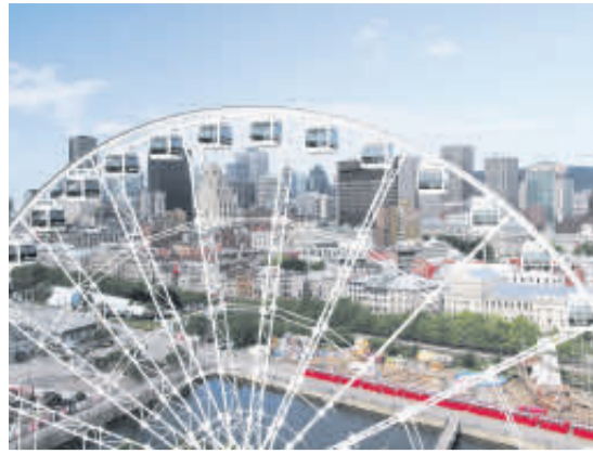
LA GRANDE ROUE. Uno de los atractivos (y con mejor vista) que tiene la ciudad.