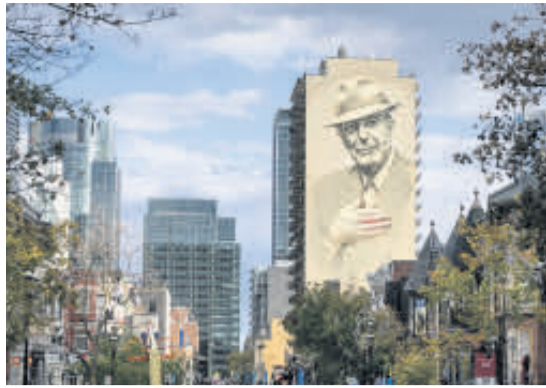
LEONARD COHEN. El artista nacido en Montreal es recordado con cariño por medio del arte urbano e incluso con un día dedicado a su inmensa memoria.