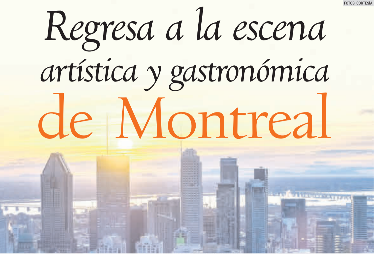
UN HORIZONTE BRILLANTE. Montreal se viste con los colores que dan paso de la primavera al verano.

Después de una tarde de compras por la calle Ste. Catherine, a unos pasos, en el 1440 Rue de la Montagne encontrarás MARCUS, restaurante elogiado como uno de los más bellos de Canadá, ubicado dentro del hotel Four Seasons y que invita a probar platos y postres innovadores hechos por el equipo culinario del reconocido Marcus Samuelsson (chef y restaurantero sueco-etíope, jefe de cocina de Red Rooster en Nueva York, juez de diferentes programas de televisión y ganador de la serie de Bravo: Top Chef Masters). Dentro del menú de esta animada brasserie contemporánea podrás